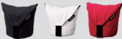
Objektivbeutel (Schwarz, Weiß, Rot) CL-N101